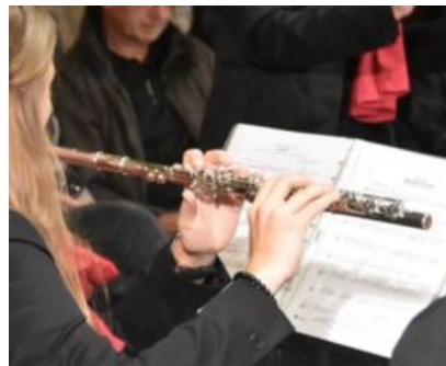
Pavillonkonzert der Musikgesellschaft Perlen-