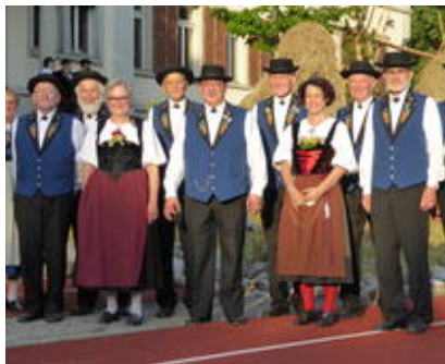
ALPHORNGRUPPE SEETAL AN DER LUGA