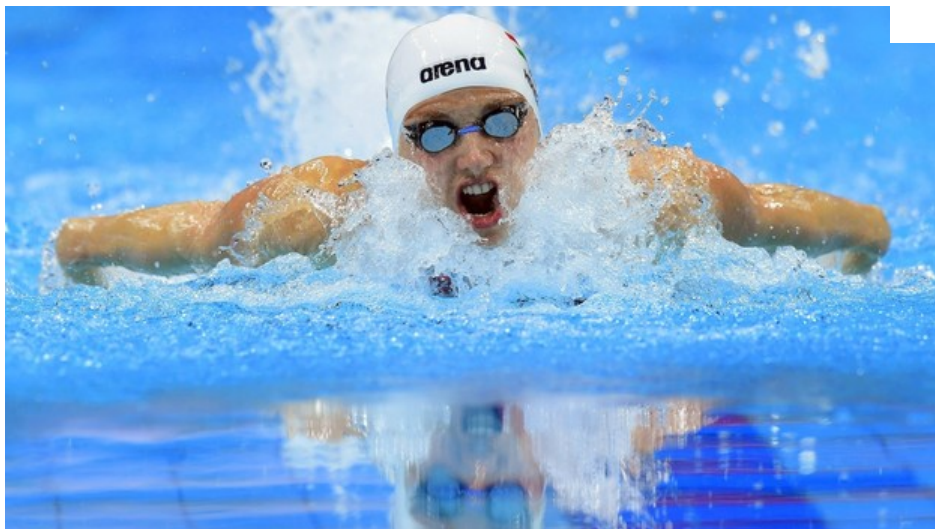
Lieferte eine Show ab: Katinka Hosszu in Berlin.